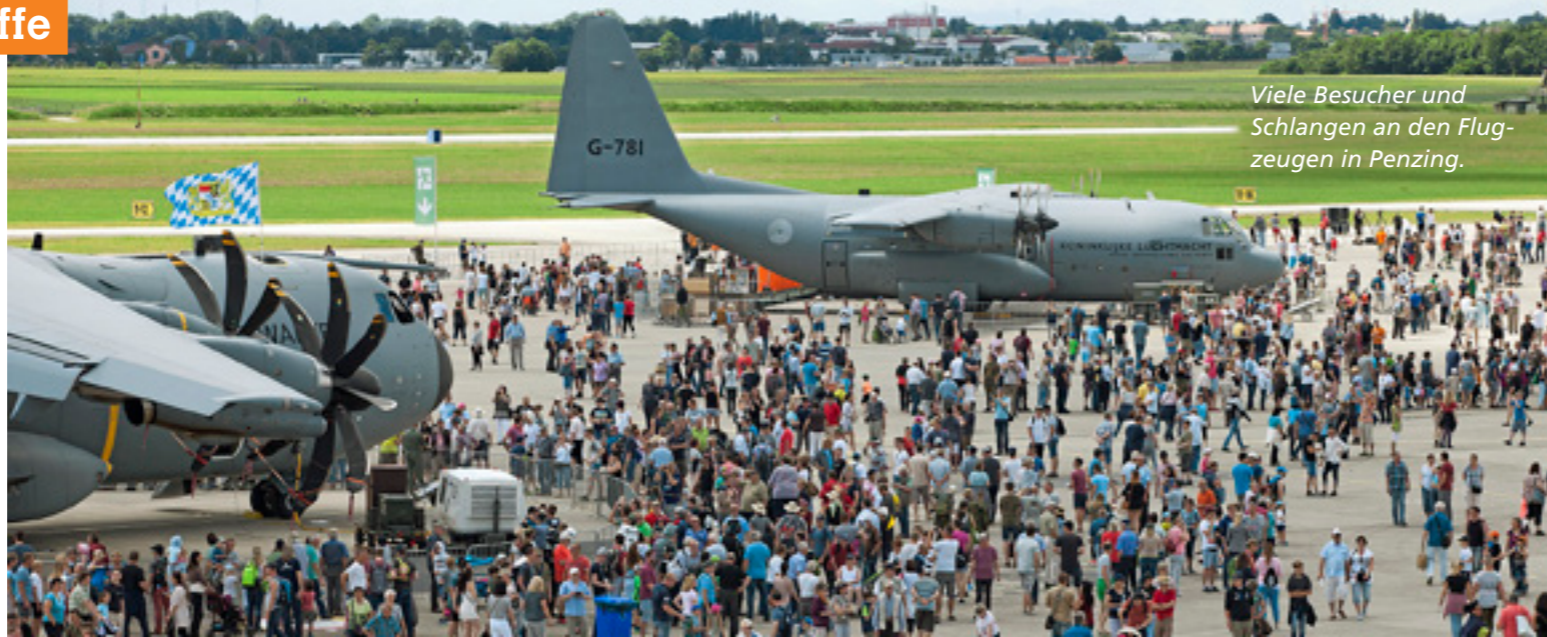
Viele Besucher und Schlangen an den Flugzeugen in Penzing.