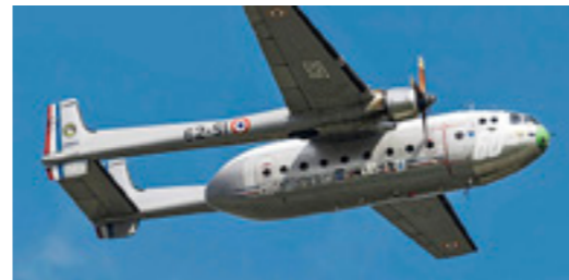
Die Noratlas gehörte einst zum Bestand des Transportgeschwaders.