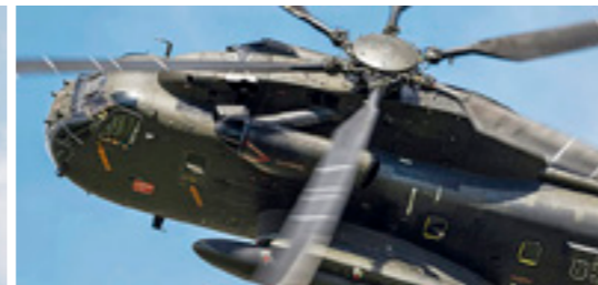
Die Sikorsky CH-53 verblüfft immer wieder mit ihrer Wendigkeit.