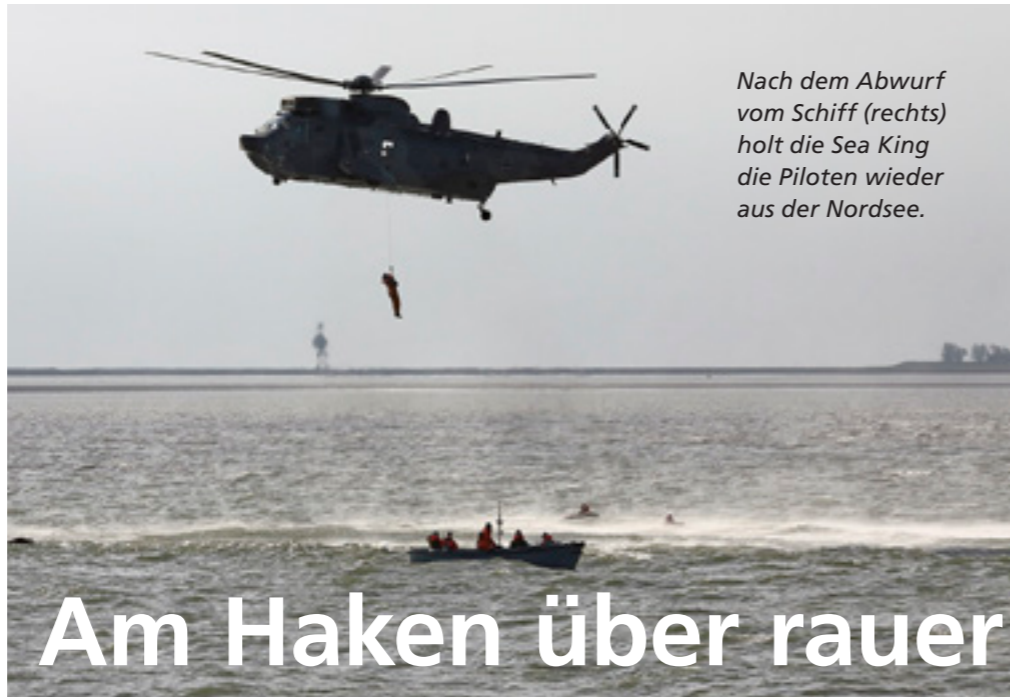
Nach dem Abwurf vom Schiff (rechts) holt die Sea King die Piloten wieder aus der Nordsee.