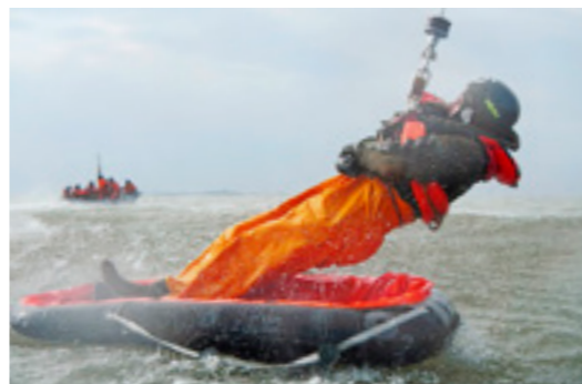
Am Windenseil wird der Pilot aus dem Schlauchboot gezogen.